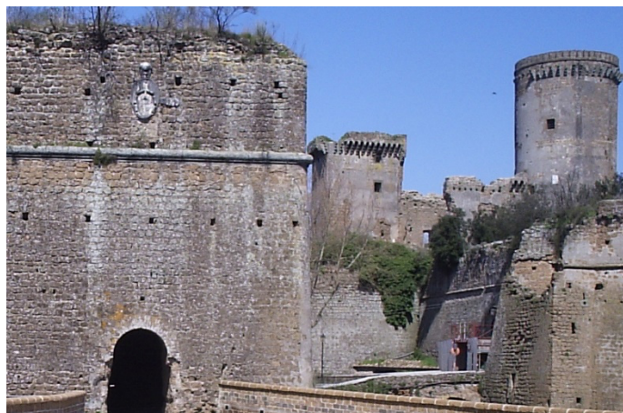
La Rocca des Borgia à Nepi

https://www.inagrofalisco.it/in-agrofalisco/i-borghi/nepi/rocca-dei-borgia