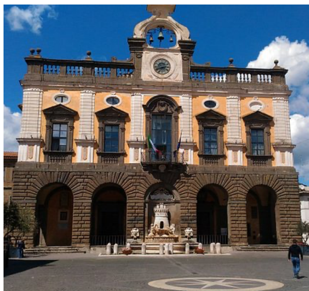
Hôtel de ville de Nepi