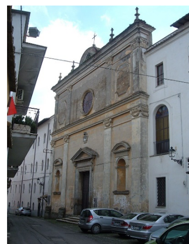
le couvent San Tolomeo, via Garibaldi (l'entrée du logement est à droite)

Nepi est une charmante ville d'eau située à une quarantaine de kilomètres au nord de Rome. Elle se distingue par son riche passé historique et culturel. Ses origines remontent à l'époque étrusque et romaine, comme en témoignent des vestiges archéologiques impressionnants. Parmi ses monuments emblématiques, la Rocca dei Borgia, une forteresse du XVe siècle, et la cathédrale de l'Assomption, offrent un aperçu fascinant de l'histoire locale. Nepi est également renommée pour ses cascades spectaculaires et son aqueduc antique, soulignant l'importance de l'eau dans cette région pittoresque. Avec une population d'environ 10 000 habitants, la tranquillité de la ville de Nepi et la beauté de son environnement en font également un lieu de séjour agréable pour ceux qui souhaitent échapper à l'agitation urbaine.