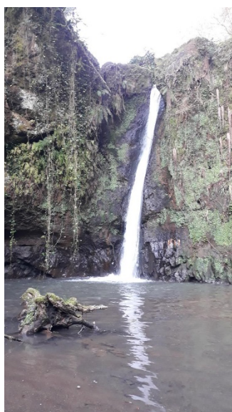
cascade du Pizzo

https://www.inagrofalisco.it/in-agrofalisco/i-borghi/nepi/rocca-dei-borgia