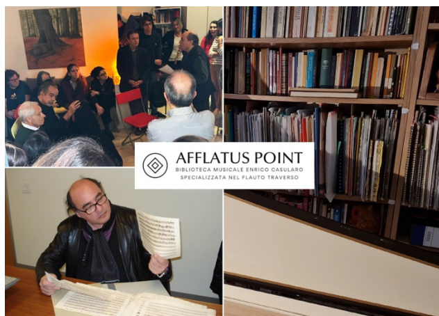
Bibliothèque musicale Afflatus Point