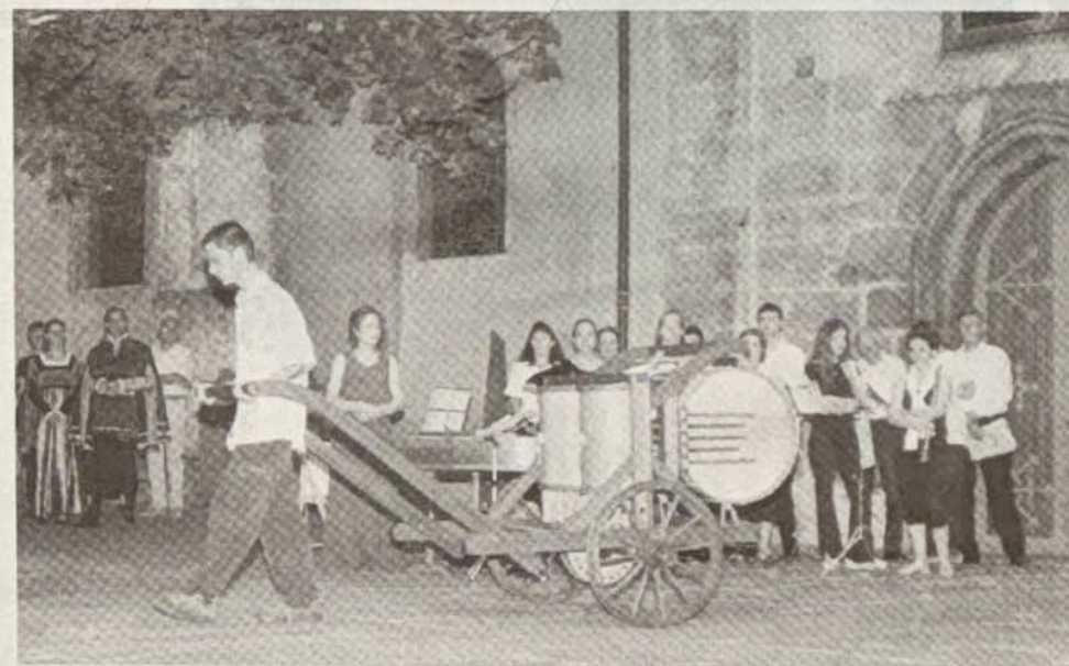
La cadence du tambour augmente avec la vitesse de traction.