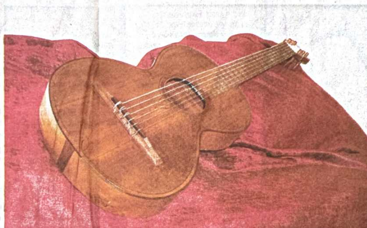
L'unique exemplaire original de la guitare «Terzina» du XIX e siècle, construite par un luthier de Palerme et restaurée dans un atelier du Musée national des instruments musicaux à Rome, sera présenté pour la première fois lors du festival Flatus.

C'est au thème de la «variation» qu'est dédiée cette dixième édition. «La musique est certainement l'un des arts qui évoque et représente le mieux le processus de la «varia-