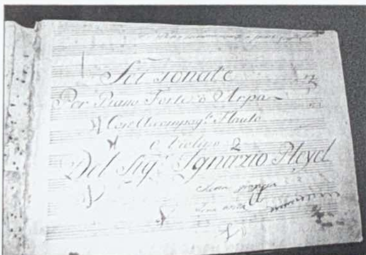
Le manuscrit original de l'œuvre de Pleyel qui sera jouée à Sion le 23 mai prochain

jouée pour la première fois dans une exécution moderne. C'est déjà là un événement inédit. Mieux, le manus-