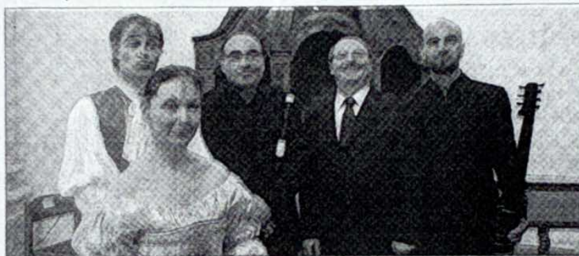
L'ensemble Flatus, se produira au château aujourd'hui.