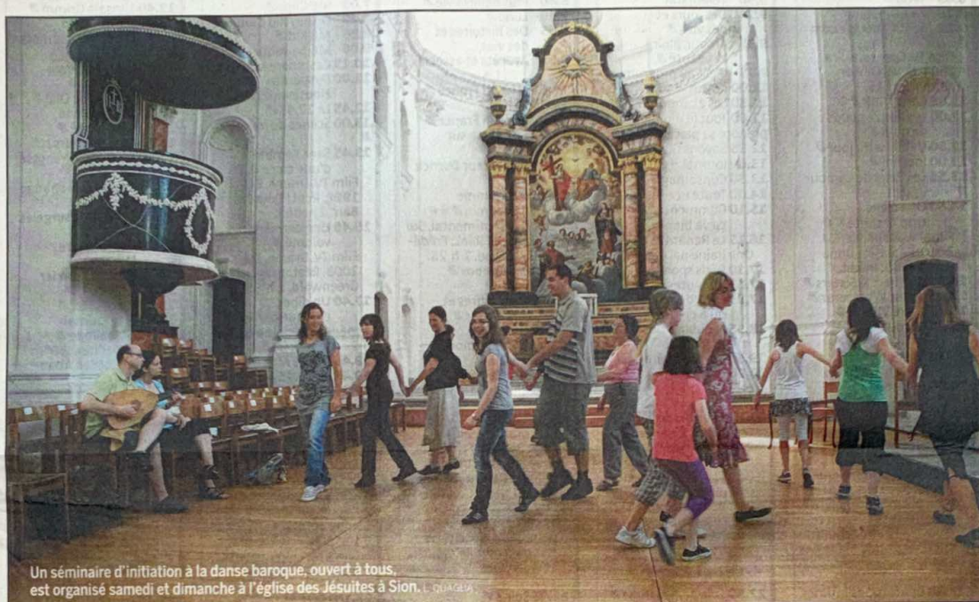
Un séminaire d'initiation à la danse baroque, ouvert à tous, est organisé samedi et dimanche à l'église des Jésuites à Sion. L. QUAGLIA

MUSIQUE Le Centre de recherches musicologiques Flatus, très actif sur la scène internationale, propose des manifestations, ce week-end, en avant-première du Festival Flatus.