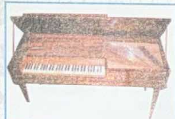
Thirion, Metz, ca. 1790