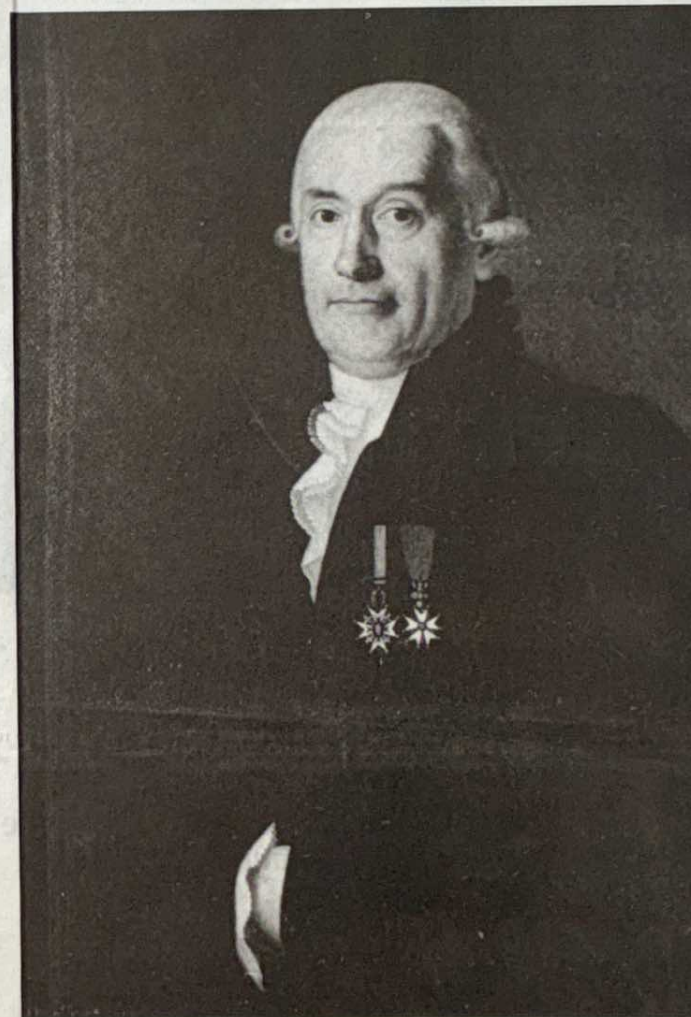
Charles-Emmanuel de Rivaz, grand homme d'Etat qui est à la base du Fonds de Rivaz, immortalisé par Antoine Hecht (Abbaye de Saint-Maurice). FESTIVAL FLATUS

L'entrée aux manifestations est libre. Collecte à la sortie.