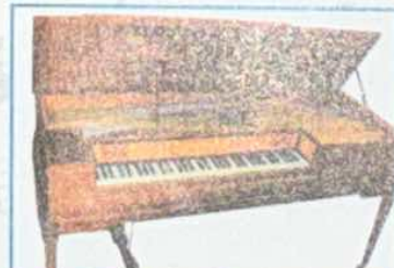
John Broadwood & Son, Londres, 1805